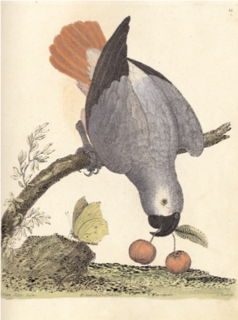
Den afrikanska jakopapegojan ( Psittacus erithacus ) anses vara den bästa av alla arter att härma människoröster och har förekommit som rumsfågel i Europa sedan 1500-talet. Linné hade en joko som kunde säga åtskilliga fraser. Han beskriver den själv som "pratsam" (Ur Eleazar Albin, Natural History of Birds 1, 1738).