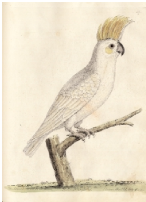
Gultofskakadua (Cacatua sulphurea) som enligt en anteckning på bilden avbildades av Eleazar Albin den 28 juli 1735. Arten var mycket uppskattad som sällskapsdjur under 1700-talet (Ur Eleazar Albin, Supplement to the Natural History of Birds , 1740).

cristatus , det vetenskapliga namn som dominerar i svenska 1700-talskällor. Arten finns med i tionde upplagan av Systema naturae (1758) med angivet ursprung ”China”. I den latinska beskrivningen heter det: ”Vit papegoja med gul nedhängande tofs”! Uppgiften att den skulle härstamma från Kina – vilket bidragit till