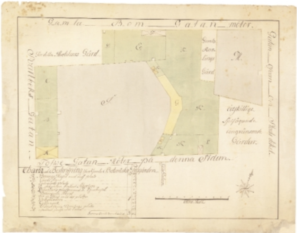
Djurhuset (markerat med F) där fåglarna hölls i Linnés trädgård kan ses på "Charta och Beskrifning öfver Gamla Botaniska Trädgården" ritad ca 1770 (Riksarkivet).

foglar, af Räntekammaren anslå trehundra dlr kop:mt samt En t:na korn och End:o blandsäd utur Academiae qvarnen, och det ifrån innewarande års början”.