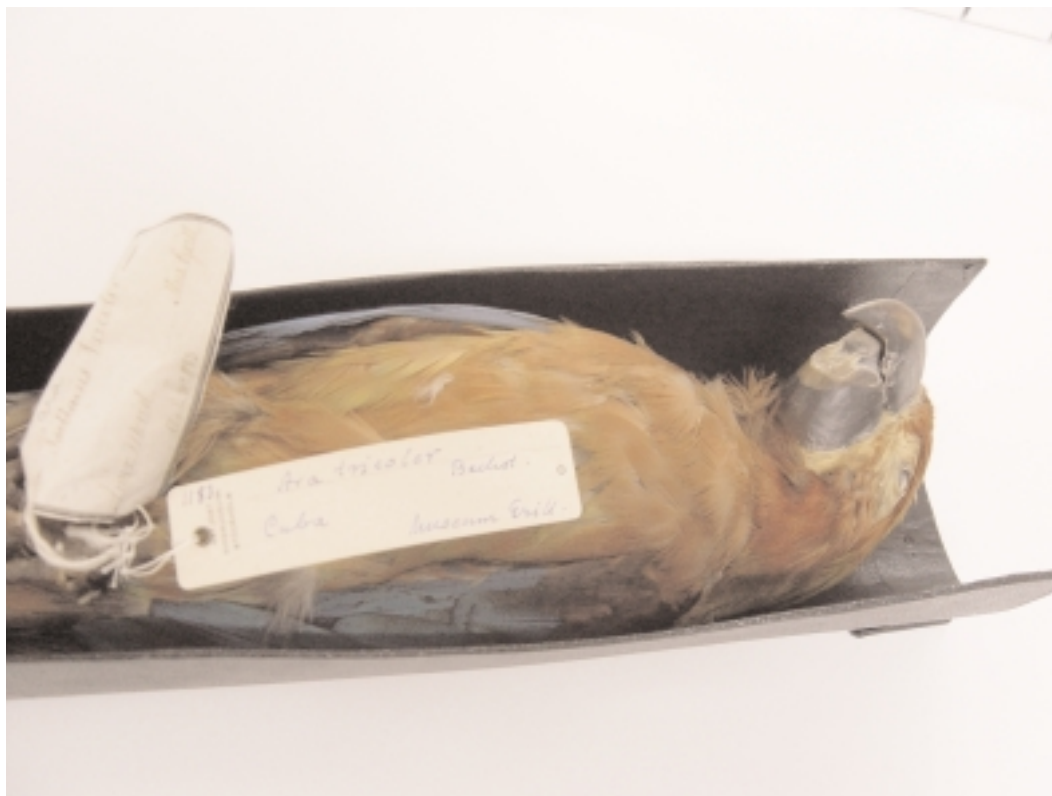
Kubaara (Ara tricolor) som förmodligen hölls i fångenskap i Sverige i slutet av 1700-talet. Skinnlagt exemplar ur Grillska samlingen från Söderfors. Arten är sedan 1860-talet utrotad.