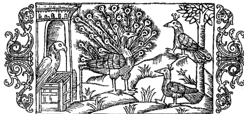
Exotiska fåglar i Sverige under medeltiden. Papegoja i bur och påfåglar (Ur Olaus Magnus, Historia de gentibus septentrionalibus 1555).

Också i Sverige – även i Uppsala – var alltså papegojor kända under senmedeltiden. I sitt stora arbete om de nordiska folkens historia, berättar Olaus Magnus