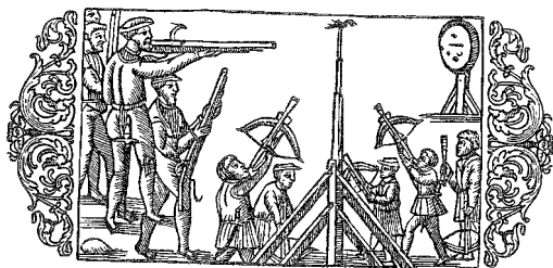
Papegojskjutning (Ur Olaus Magnus, Historia de gentibus septentrionalibus 1555).

papegojskjutning förekommit in på 1900-talet. 11